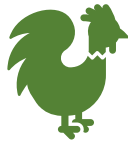
Chicken & Chips Chicken Nuggets · Pommes 6,00 €