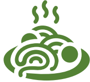
Tomatenattacke Spaghetti · Tomatensoße 4,80 €