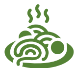
Tomatenattacke Spaghetti · Tomatensoße 4,80 €

Liebe Gäste, unsere Kindergerichte sind besonders kinderfreundlich kalkuliert. Wir bitten Sie daher um Verständnis, dass wir bei Bestellung für Erwachsene einen Aufpreis von 3,00 € pro Gericht berechnen,